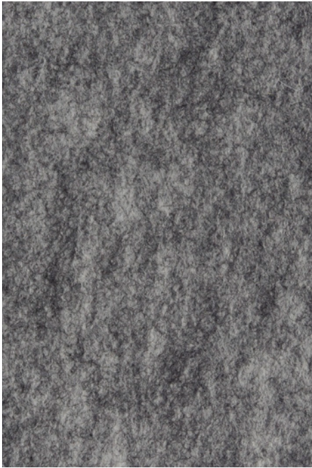
jasny szary / light grey / hellgrau