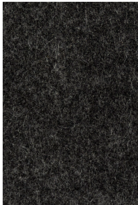
ciemny szary / dark grey / dunkelgrau